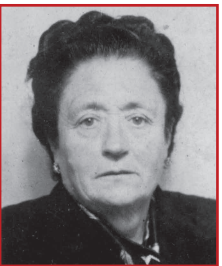
© ANCEB-AF • Xavier Pellicer. Modern Study

La Dolors va ser tan popular que fins i tot se n'havia arribat a fer mofa en les representacions teatrals de Solsona.