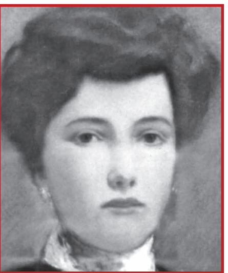
Xavier Pellicer. Modern Study