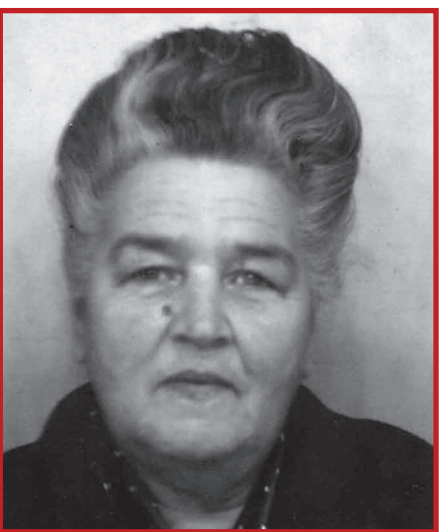
© ANCEB-AF • Xavier Pellicer. Modern Study