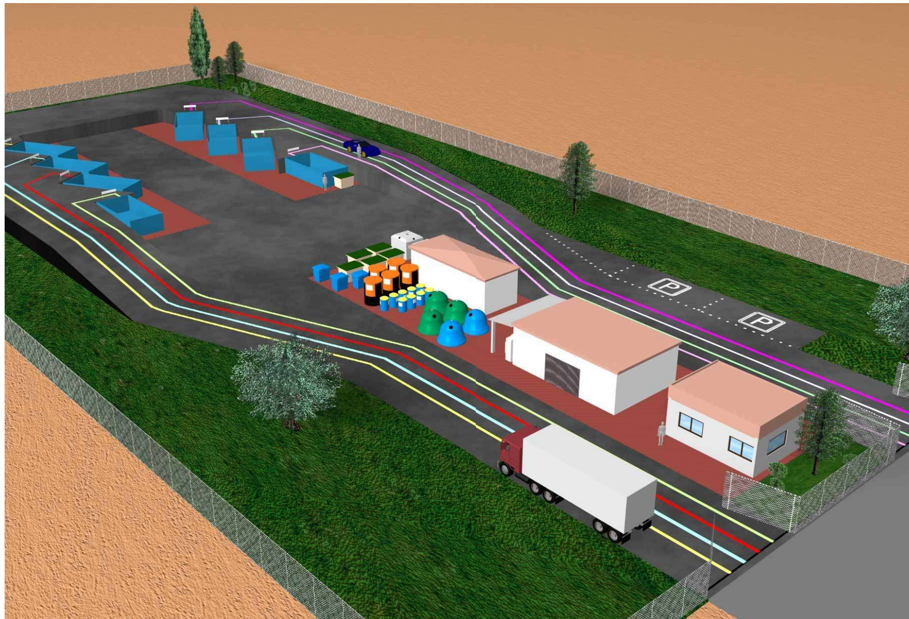
Esquema general de la planta

Els camions que s'han d'endur els contenidors plens cap a la planta de reciclatge o de tractament han de disposar de l'espai necessari per maniobrar amb independència del trànsit de vehicles particulars.