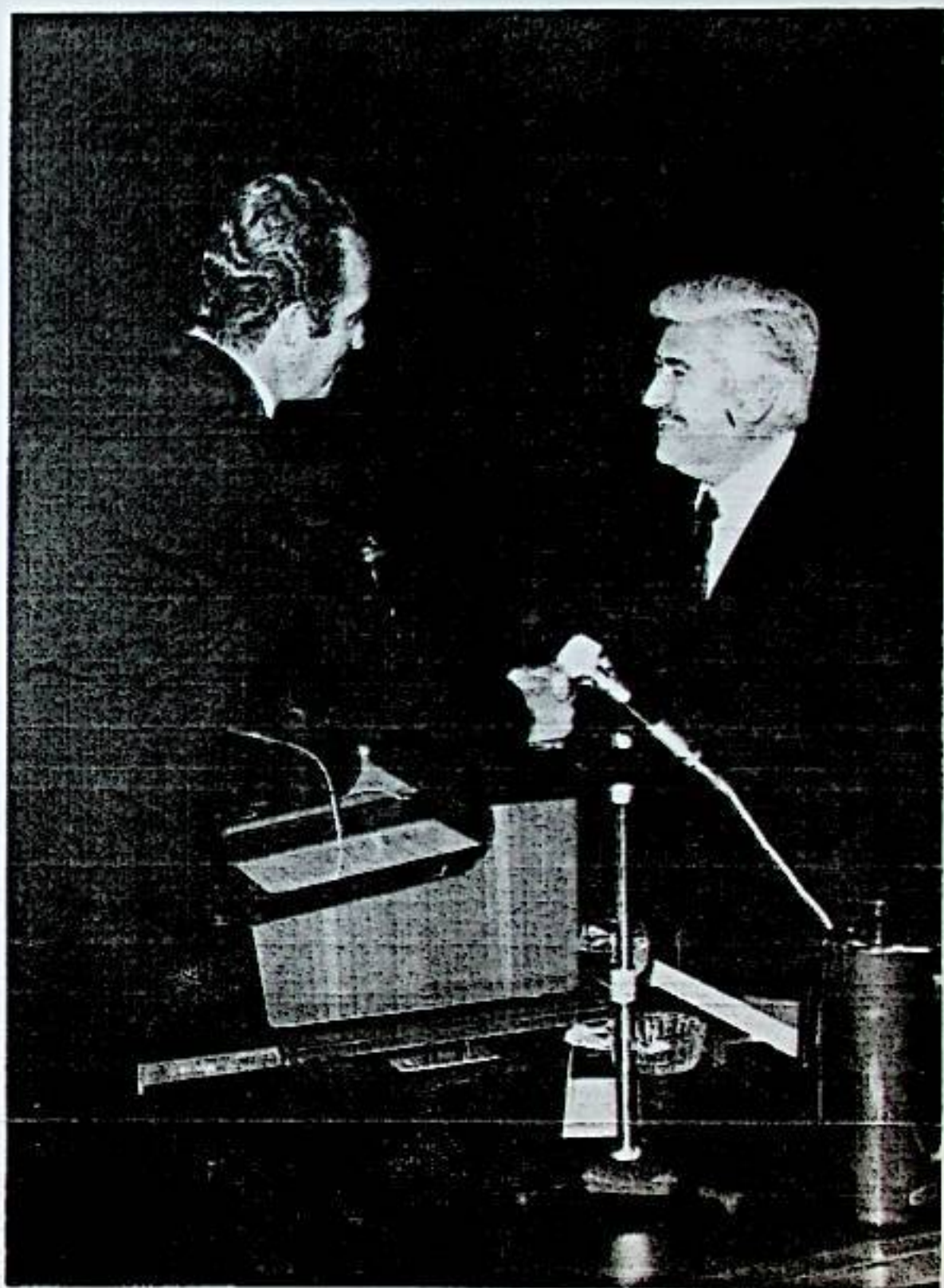
S. M. L. Juan Carlos I. Suces entrega a nuestro Alcalde. del Trofeo Avila. Premio Nacional del Deporte 1976. concedido a la Villa de Santa Bárbara.