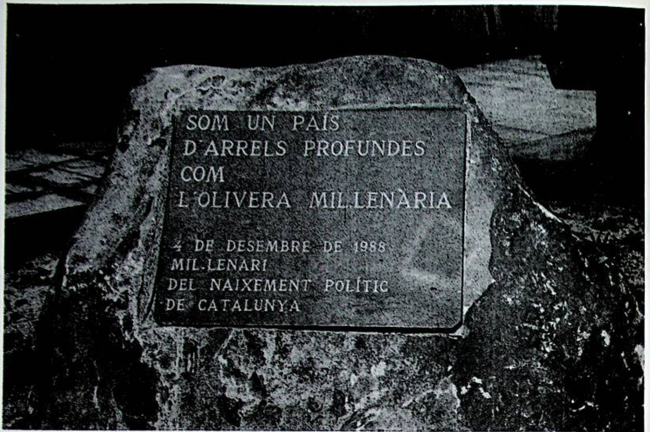
Celebració del Mil·lenari de Catalunya. 4-XII-88