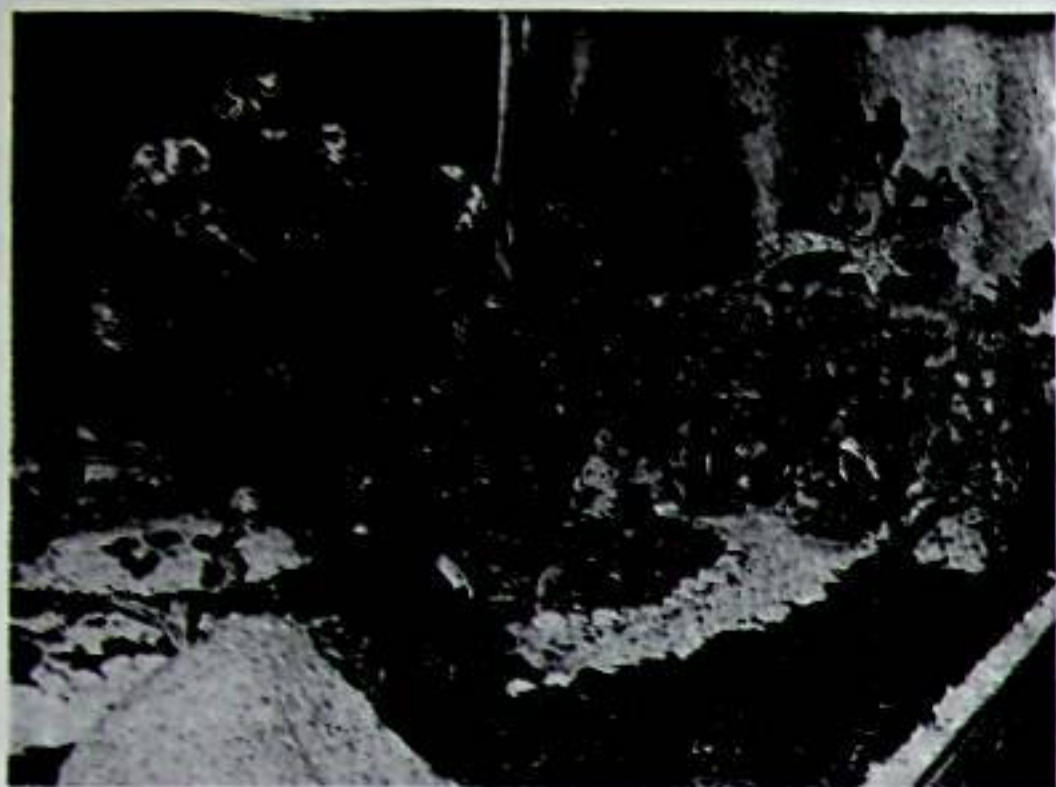
Pessebre realitzat a la Llar del Jubilat

La tarda del dia 5 de gener es nota a l'ambient una sensació especial; per damunt del neguit de comprar, dels corre-cuites, hi ha il·lusió en la cara de tothom: en la dels petits i en la dels grans. I a la fi arriba el moment esperat: els Reis acaben tornant, els Reis tornen sempre... i es produeix la relació màgica. És igual si ja hem perdut la innocència: és tan bonic de veure la cara que fan els infants, és tan meravellós tornar-se a sentir un poc nens, és tan lícid somniar en el regalet sorpresa... I és que els Reis són el reflex i el símbol que hi ha algú pensant en nosaltres... i que nosaltres hem pensat en algú.