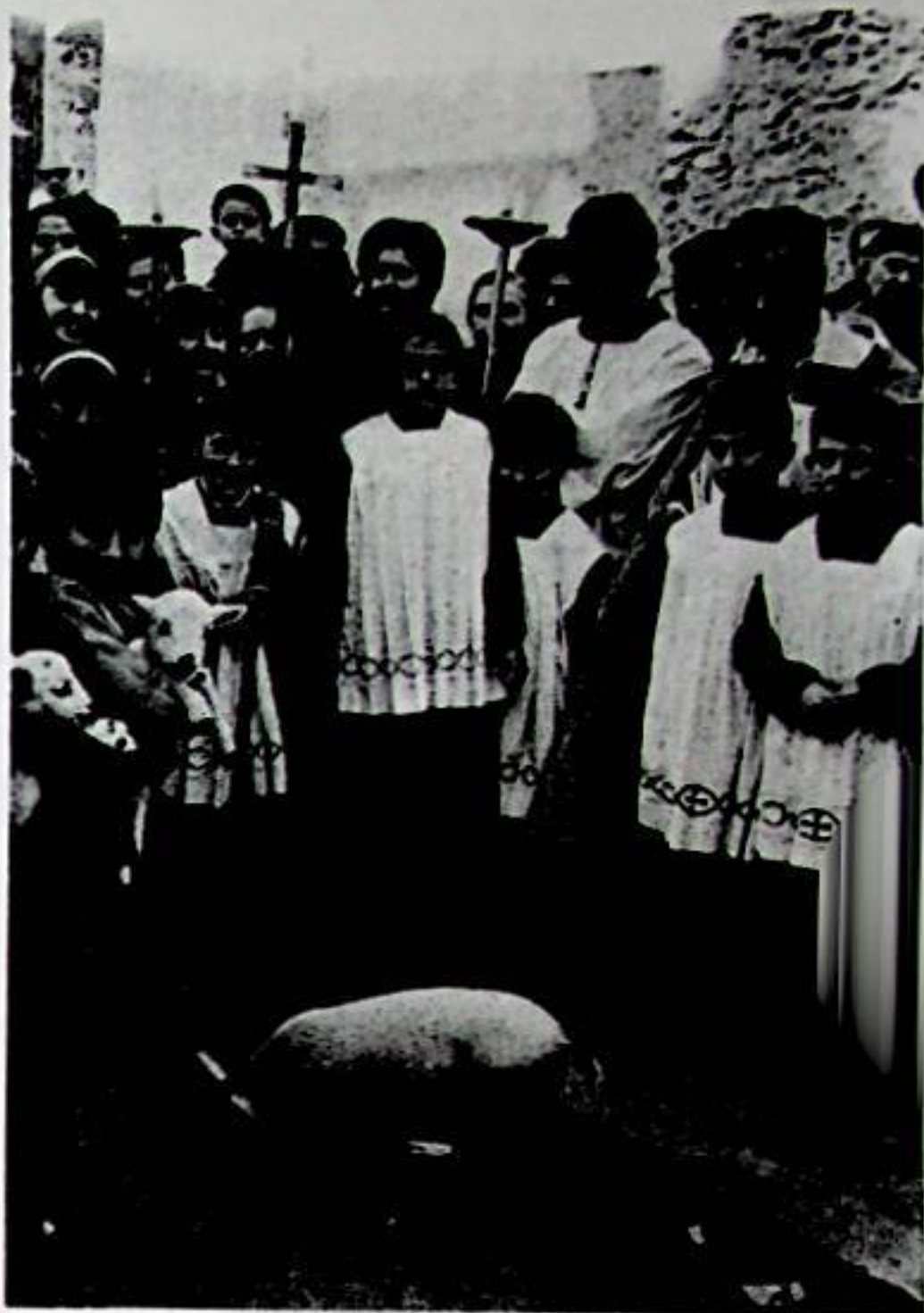
Festa Sant Antoni Abat, 17 gener 1967