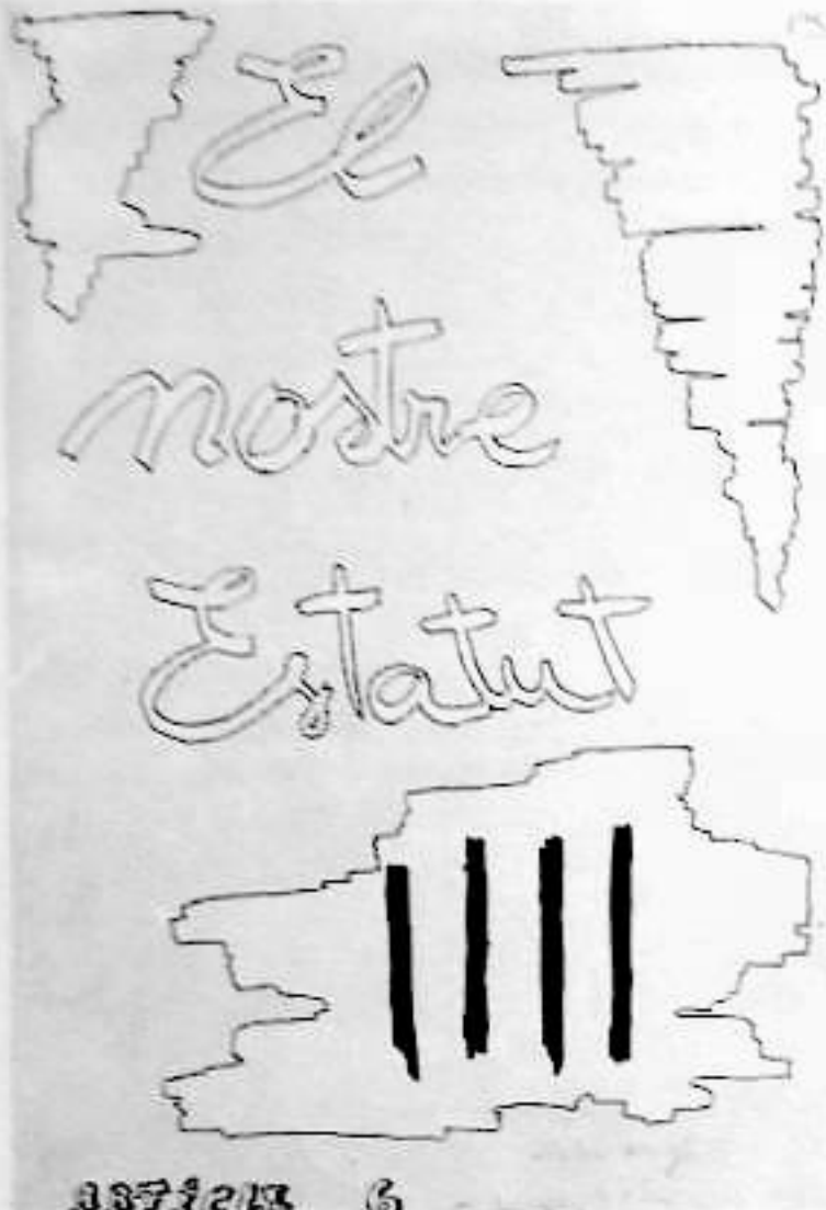
VÍCTOR MONFORTE i MORESO Cicle Superior (3r. Comarcal)