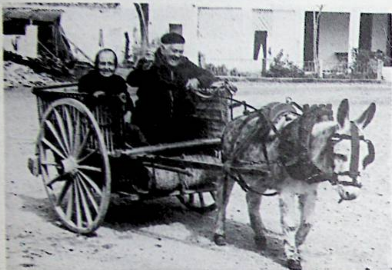
Plaça de l'estació 1966