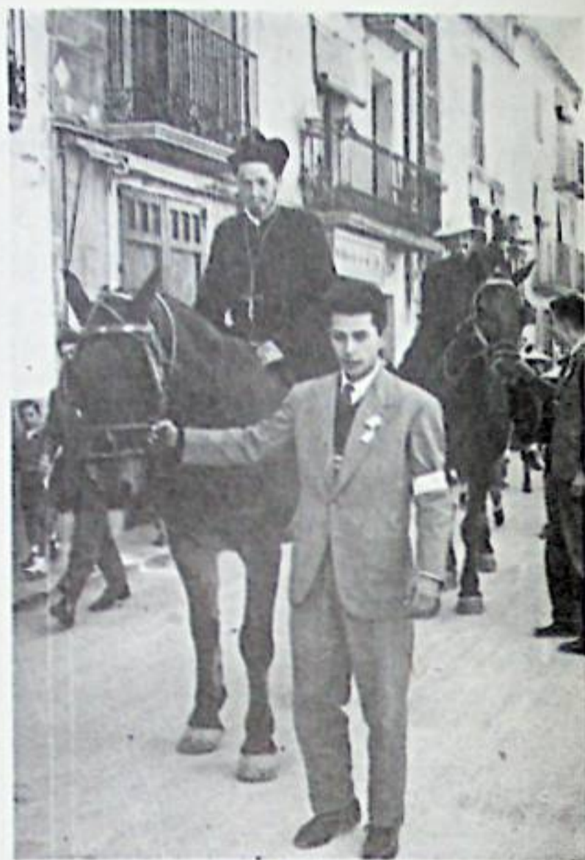
Dia del Domund