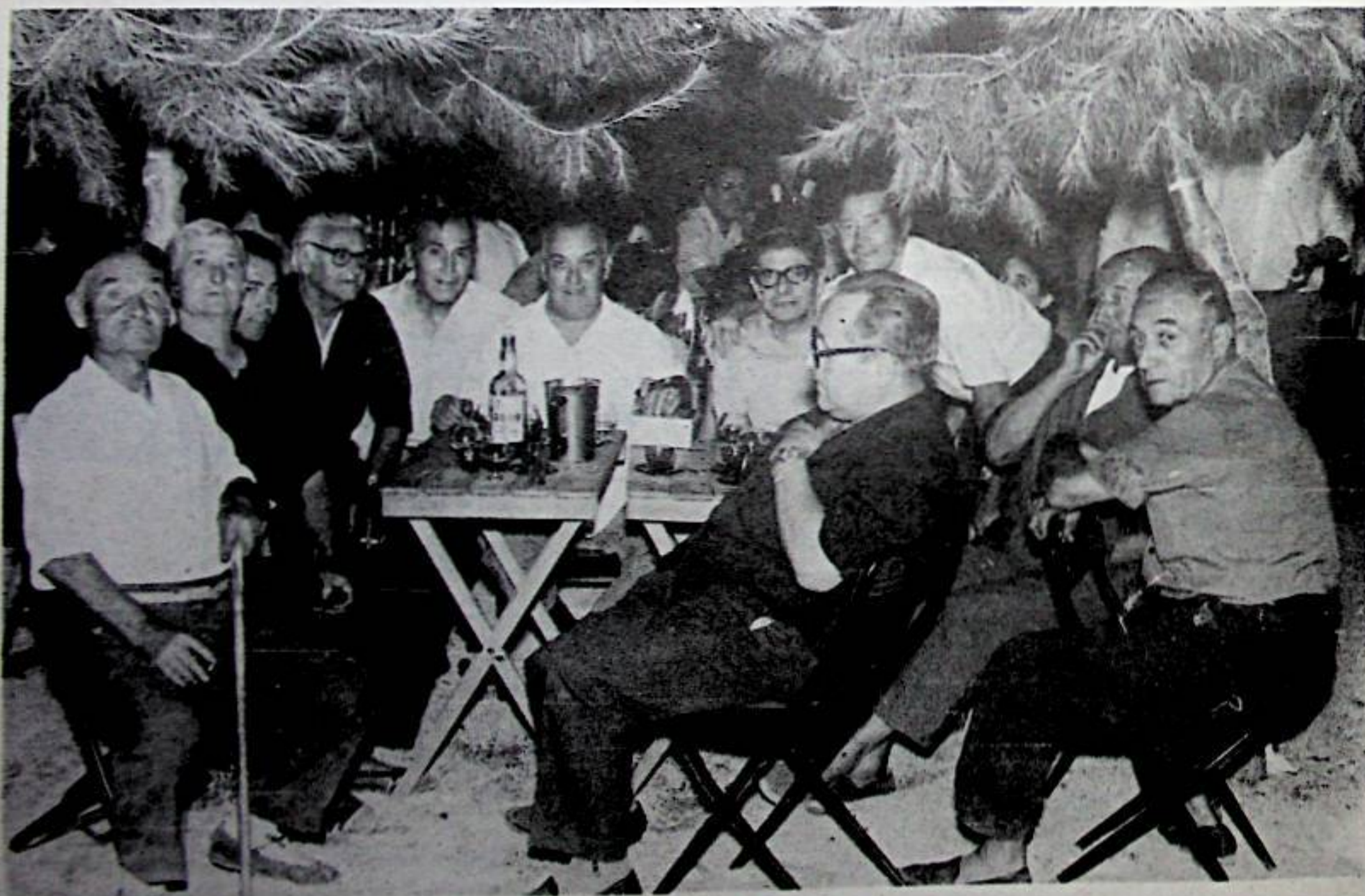
Tertúlia a la Piscina d' "ASTACIA"

Es prega féssiu arribar fotos el més antigues possible a l'Ajuntament, per a aquesta secció