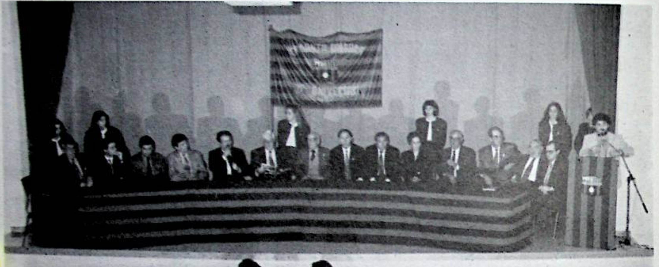
Presidència de l'acte, celebrat el 4 de desembre